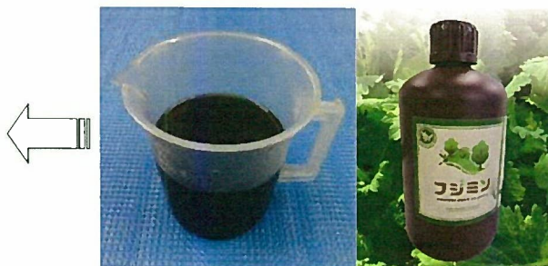
植物活性剤:フルボ酸(フジミン®)